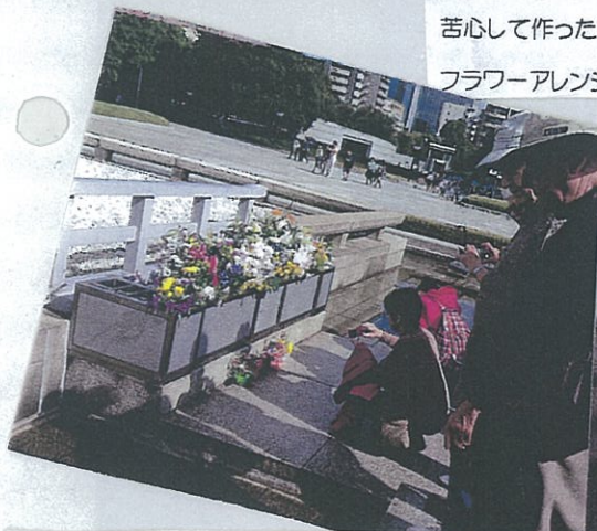
苦心して作ったオリヅルの フラワーアレンジメントを献花