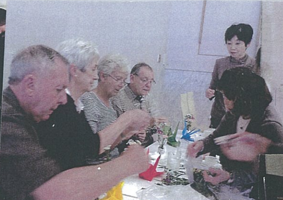
オリヅルづくりに興味津々