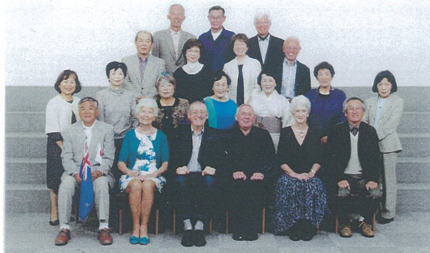
ニュージーランド・ヒロシマ交流会 平成26年10月18日 於 ホテル メルパルク広島