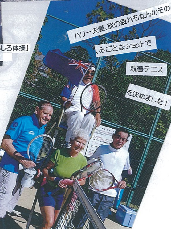
ハリー夫妻、旅の疲れもなんのその みことなショットで