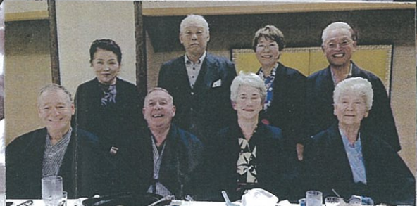
いつもお世話になります 豊平浄土寺の朝枝ご夫妻と