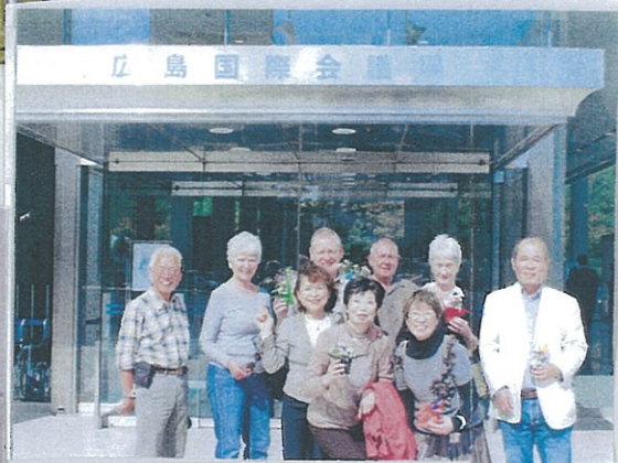
これから資料館見学