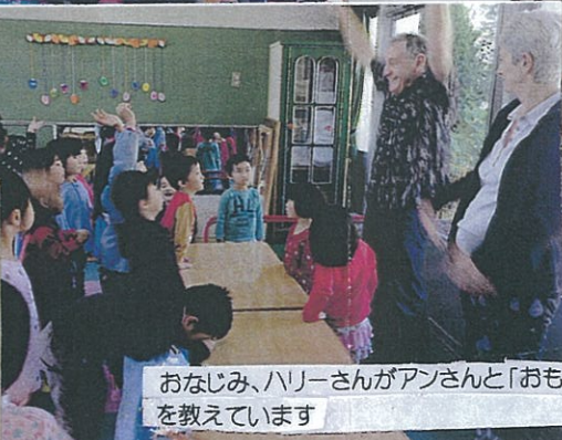
おなじみ、ハリーさんがアンさんと「おもしろ体操」 を教えています