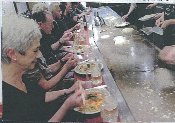
お昼にはカキ入りお好み焼き、宮島で